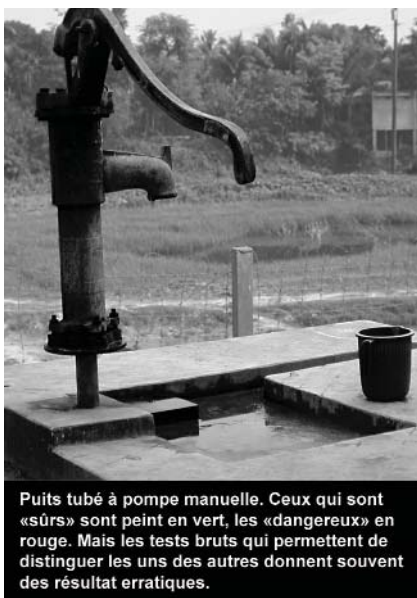
Puits tubé à pompe manuelle. Ceux qui sont «sûrs» sont peints en vert, les «dangereux» en rouge. Mais les tests bruts qui permettent de distinguer les uns des autres donnent souvent des résultats erratiques.