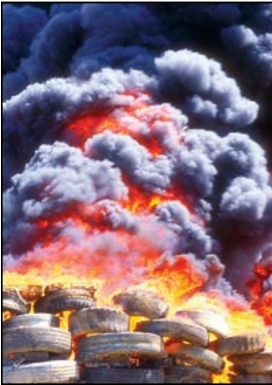
En feu à Mexico.

Plus d'un demi milliard de voitures parcourt les routes du monde entier. Les maintenir en mouvement nécessite environ 1,1 milliard de pneumatiques neufs chaque année. Chaque pneu est un élément sophistiqué de la technologie des transports, à mille lieux de son ancêtre en cuir, le pneu à air, inventé par l'Anglais Robert Thomson en 1845. Ce modèle a disparu, mais un autre a survécu : les descendants du pneu de vélo en caoutchouc mis au point un peu plus tard par John Boyd Dunlop, un vétérinaire irlandais. Le pneu produit par Dunlop, adapté à l'usage de la voiture, mena, pas à pas, vers le pneu qui domine aujourd'hui, le pneu radial ceinturé d'acier.