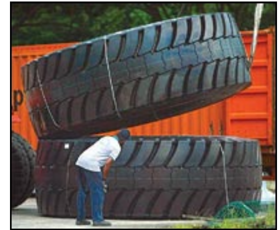
Le pneu le plus grand du monde pèse 5,5 tonnes.

L'utilisation la plus répandue pour les pneus usés (près de la moitié des pneus mis au rebus aux Etats-Unis) est leur transformation en carburant. Les pneus sont brûlés par des cimenteries, des centrales produisant de l'énergie à partir de déchets et les chaudières industrielles. C'est une solution tentante au problème d'accumulation, mais brûler un pneu ne produit pas plus d'un sixième de l'énergie qui a été nécessaire à sa fabrication. En outre, le pneu est composé à 85 % de carbone, ce qui en fait une source supplémentaire d'émissions de gaz à effet de serre. Des développements plus récents ont permis d'incorporer des poudres fabriquées à base de pneus dans des tapis, toitures et produits moulés.