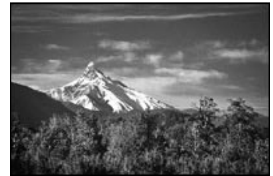
Dans le nouveau parc national de Corcovado, Chili.