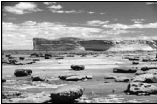
Littoral de Monte León.