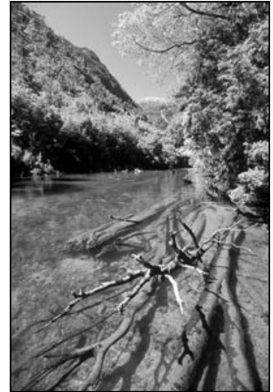
Rivière Vodudahue, Pumalín Park.

En Argentine, les grands propriétaires terriens sont Luciano et Carlo Benetton, les géants italiens de la mode; à eux seuls, ils possèdent cinq estancias et, au total, plus de 800 000 hectares. Bien qu'en ce qui les concerne, leurs élevages de moutons visent davantage à fournir à leurs entreprises de la laine de mérinos qu'à sauver la planète, ces designers millionnaires ont également été confrontés à l'opposition locale. En 2004, notamment, un douloureux conflit qui avait éclaté entre les Benetton et les Indiens Mapuche locaux au sujet des terres s'est transformé en scandale international. Toute une campagne, menée par des activistes sous le nom de « United Colors of Land Grab », s'en est d'ailleurs prise farouchement aux Benetton.