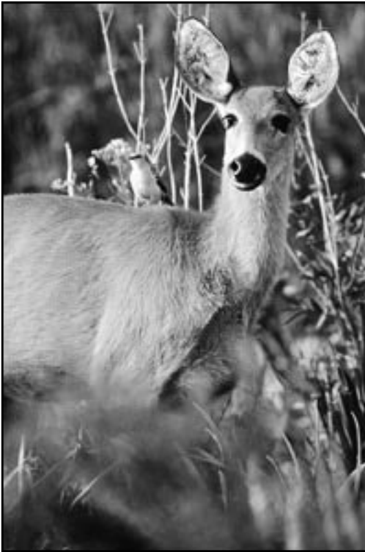
Cerf des marais et compagnon, Esteros del Iberá.